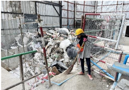
รูปที่ 9 พนักงานทำความสะอาด