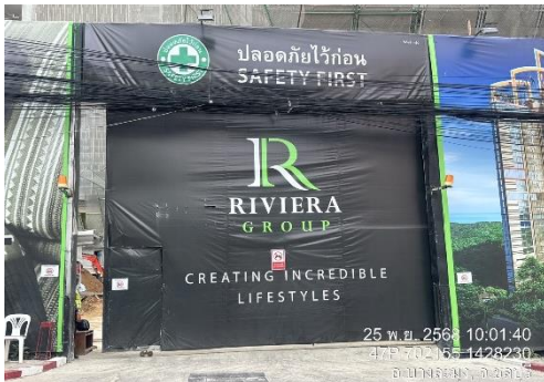
รูปที่ 5 ประตูทางเข้า-ออกปิดทึบ

ของบริษัท ริเวียร่า มาลิบู พร็อพเพอร์ตี้ ดีเวลลอปเม้นท์ จำกัด