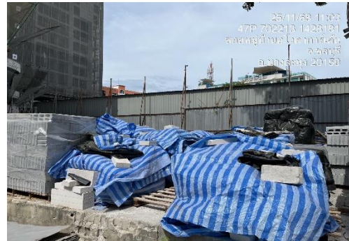
รูปที่ 6 พื้นที่จัดเก็บวัสดุก่อสร้าง