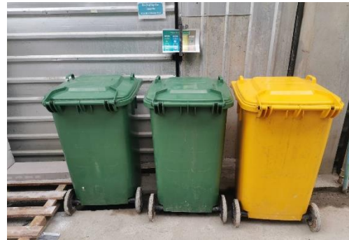
รูปที่ 10 ถังรองรับขยะมูลฝอย

รวบรวมการปฏิบัติงาน โดยเจ้าหน้าที่ของโครงการ และทีมงานบริษัท ทีเอ็นพี เอ็นไวรอนเม้นท์ จำกัด