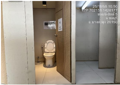
รูปที่ 7 สุขภัณฑ์